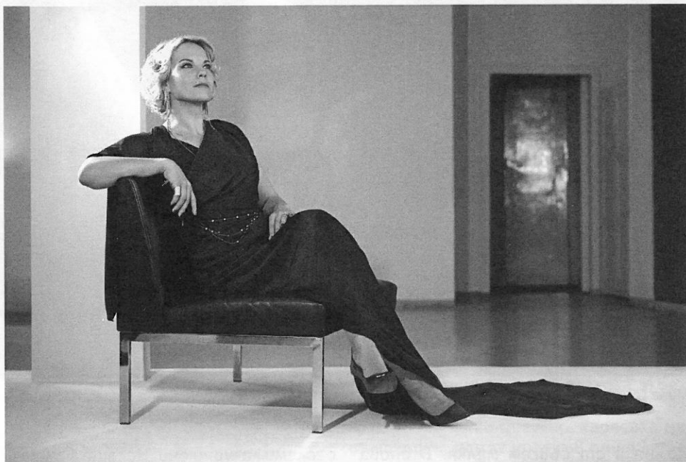
Елина Гаранча ще пее в София на 23 септември

Ще имаме много детски заглавия, сред които са познатите „Снежанка и седемте джуджета“ и „Малката кибритопродавачка“, както и най-новият