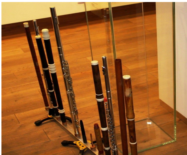
Деветте флейти, на които свири Христо Христов

От 2013 е докторант в департамент „Музика“, програма „Музикално изпълнителско майсторство“.